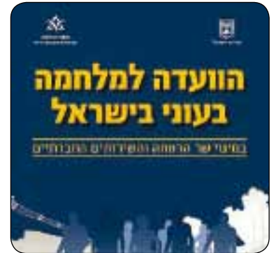
דו"ח הוועדה למלחמה בעוני. רבע מכלל הקשישים חיים מקצבת הבט"ל בלבד

מתחת לקו העוני ואין לו שום הכנסה, למעט קצבת הזקנה של הביטוח הלאומי. ייתכן ששיעור זה אף גבוה יותר בשל משקלה של האוכלוסייה החרדית בעיר. באמצע חודש יוני הוגש "דו"ח העוני" לראש הממשלה ולשר הרווחה. יו"ר הוועדה, אלי אלאלוף, צירף לדו"ח היבש מבוא אישי, שיש בו כתב אישום חריף נגד החברה הישראלית בכלל ונגד קברניטיה בפרט. בין השאר כתב: "ישראל של היום מזניחה את תפקידה ולא עושה די למען השכבות החלשות. ערכי יסוד כגון עזרה, סולידריות וערבות הדדית הלכו ואיבדו את מרכזיותם בחברה הישראלית".