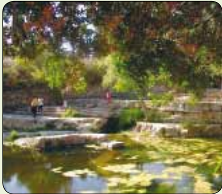
עין חמד. יפה ומושכת מתמיד

"גם הדרך לאיתקה, המקום בו נמצא האוצר, היא אוצר בפני עצמו", אמר המשורר המצרי קוואפיס. על משקל זה אפשר