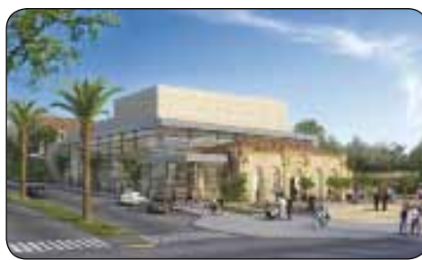
היכל התרבות החדש ברחובות. תמונת הדמיה