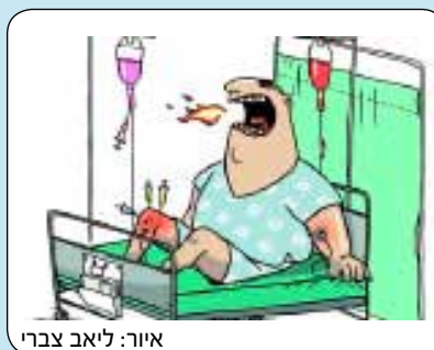
איור: ליאב צברי

כשאדם צעיר מתלבט באיזה מקצוע לבחור, הורים, אחים ואחיות, סבים וסבתות, נותנים עצות. אני למשל, הצעתי לאחד מנכדיי ללמוד רפואה ולהתמחות בגריאטריה. בתקופתנו, עם העלייה בתוחלת החיים, זהו תחום חשוב ומעניין. מי שבוחר ללמוד רפואה, כמו הרבה מקצועות אחרים, אולי בוחר במקצוע לכל החיים. במהלך של שנות הלימוד הרבות יש לפעמים הרהורי חרטה: האמנם בחרתי במקצוע הנכון, האם זה מתאים לי? מרגע שמסתיימים הלימודים והרופא נכנס לבית החולים, עליו להפנים שיש לא רק הצלחות אלא גם אכזבות.