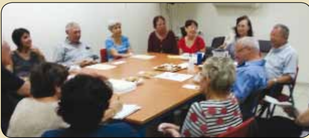
המתנדבים החדשים ברכ-שיח עם ראשי העמותה. תופעת ההתנדבות בקרב גמלאים עדיין אינה מובנת מאליה

תופעת ההתנדבות נפוצה בחברתנו. גמלאים רבים ממלאים חלק מזמנם הפנוי בפעילות למען הקהילה במסגרת גופים שונים, אולם פעילות זו אינה מובנת מאליה. יש המרימים גבה ואומרים אנחנו תורמים למשפחתנו וזה מספק אותנו.