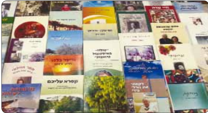
לקט מתוך אוצר חוברות התיעוד והזיכרון שפורסמו בעל"ה