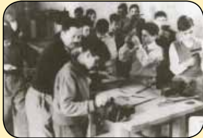
שיעור נגרות בבית ספר סמילנסקי.