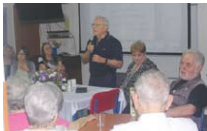
יו"ר העמותה הרמלך מציג את פעילותה

האולם המשודרג של קפה תרבות עליה ברחובות ביום שלישי האחרון היה מלא מפה לפה. היה זה מפגש ראשון מסוגו ברחובות. רבים מתושביה של העיר מבוגרים וגיל הביניים נענו להזמנת עליה ובאו להכיר את עמותת המתנדבים הגדולה בעיר ואת פעילותיה המגוונות למען האוכלוסייה המבוגרת.