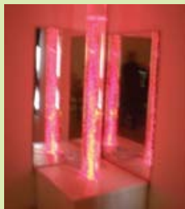
עמוד בועות בסנוזלן

מרכז היום של עמותת על"ה, ברחוב בורוכוב 12 ברחובות, מאפשר למבוגר ליהנות מכל העולמות: להמשיך לגור בביתו ובסביבתו המוכרת ולקבל מענה בתחום החברתי, החווייתי, היצירתי והרגשי. המרכז מספק גם ארוחות בוקר וצהריים והסעות מהבית למרכז ובחזרה.