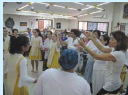
הקשישות מצטרפות לריקוד