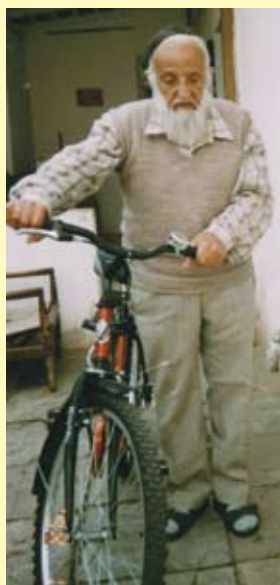
קרטה בן ה-85

נאחל לו עוד שנים רבות וטובות בבריאות ונחת.