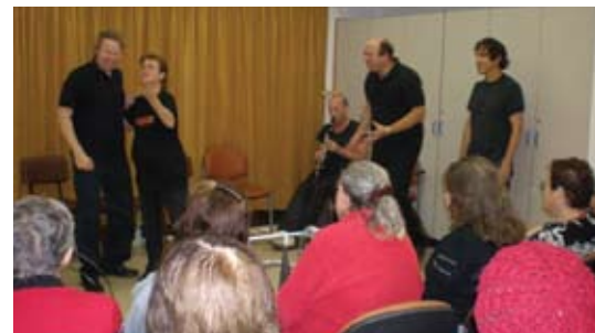
שחקני "פלייבק" בפעולה