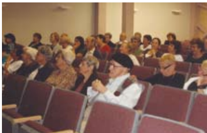
הגמלאים שהגיעו לגבורות