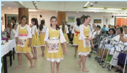
תלמידות ביה"ס ויצמן

מסיבת חג השבועות במרכז היום לאזרח המבוגר שילבה טקס לכבוד החג והופעות מחול. המסיבה