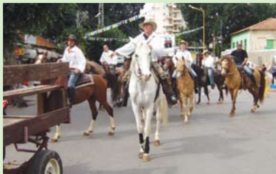
המשך בעמ' 2

כתבה: נירה עפרוני ביום אביב נאה, בבוקר יום שישי י"ב באדר תש"ע, לבש רחוב יעקב חג. בלונים, כרכרות, סוסים ואווירת ציפייה לקראת בואו של נשיא המדינה שמעון פרס. על הבמה שהוקמה לרגלי עץ האקליפטוס הוותיק התקבל הנשיא על ידי ראש העיר רחמים מלול וחברי מועצת העיר. סיפרנו לנשיא שאנו, שתי ילדות רחובות, מייצגות את העיתון "כיוון חדש", והוא שאל על הנעשה בקרב הגמלאים. כרכרה מקושטת אספה את נשיאנו לעבר בית דונדיקוב במעלה הרחוב. 16 סוסים ורוכביהם ליוו את הכבודה. נשארנו לראיין אחדים מתושבי העיר על רחובות והקשר שלהם אתה. להלן מה שליקטנו: